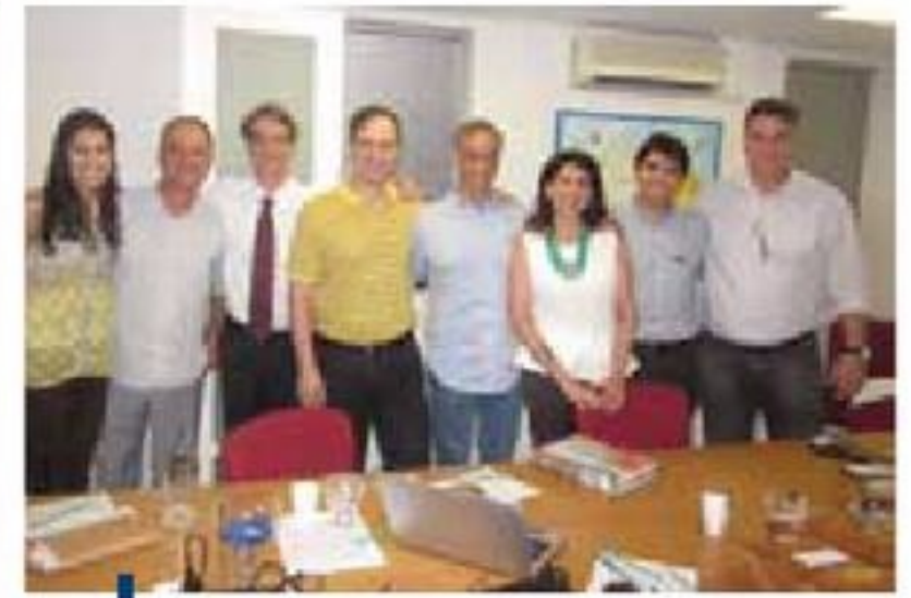
Registro da última reunião da CEC em 2012