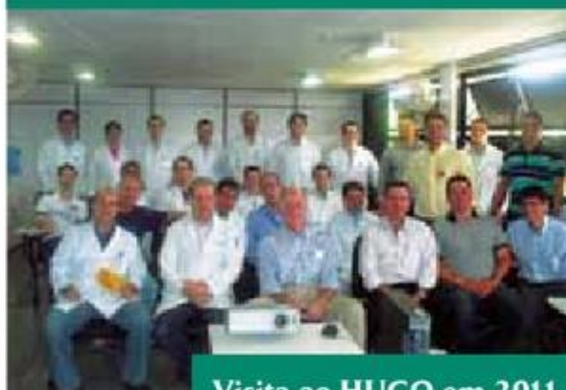
Visita ao HUGO em 2011