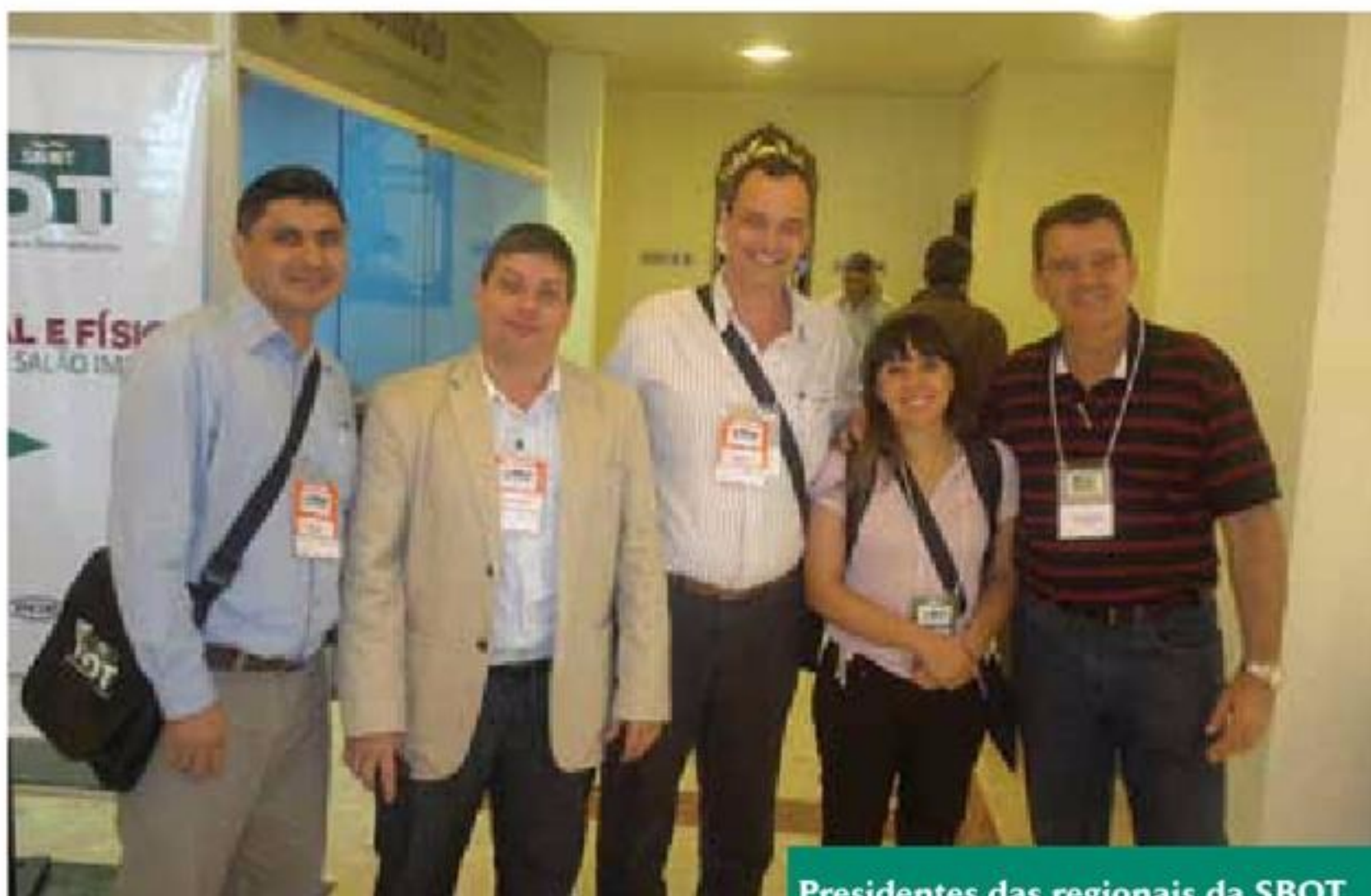
Presidentes das regionais da SBOT