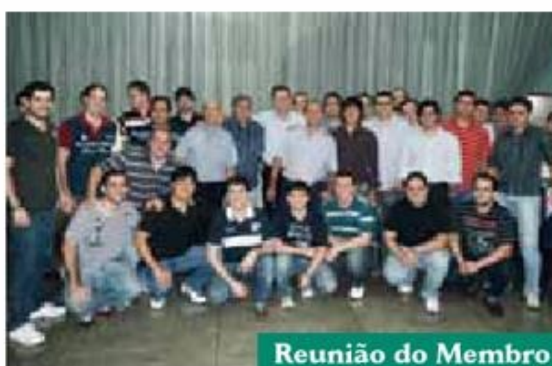
Reunião do Membro Superior em 2011

Traumatologia e Ortopedia do Centro-Oeste do Brasil (COTCOB), sediada em Goiás de 11 a 14 de agosto, inaugurou os acontecimentos científicos do segundo semestre. Pensando em integrar ciência e lazer para um melhor aprendizado, foi escolhido o Rio Quente Resorts. O evento contou com a presença internacional do espanhol Miguel Pons, vindo de Barcelona especialmente para o congresso. Com mais de 200 inscritos, os três dias do congresso foram marcados por uma participação ativa de todos os congressistas e foi coroado por uma inesquecível programação social.