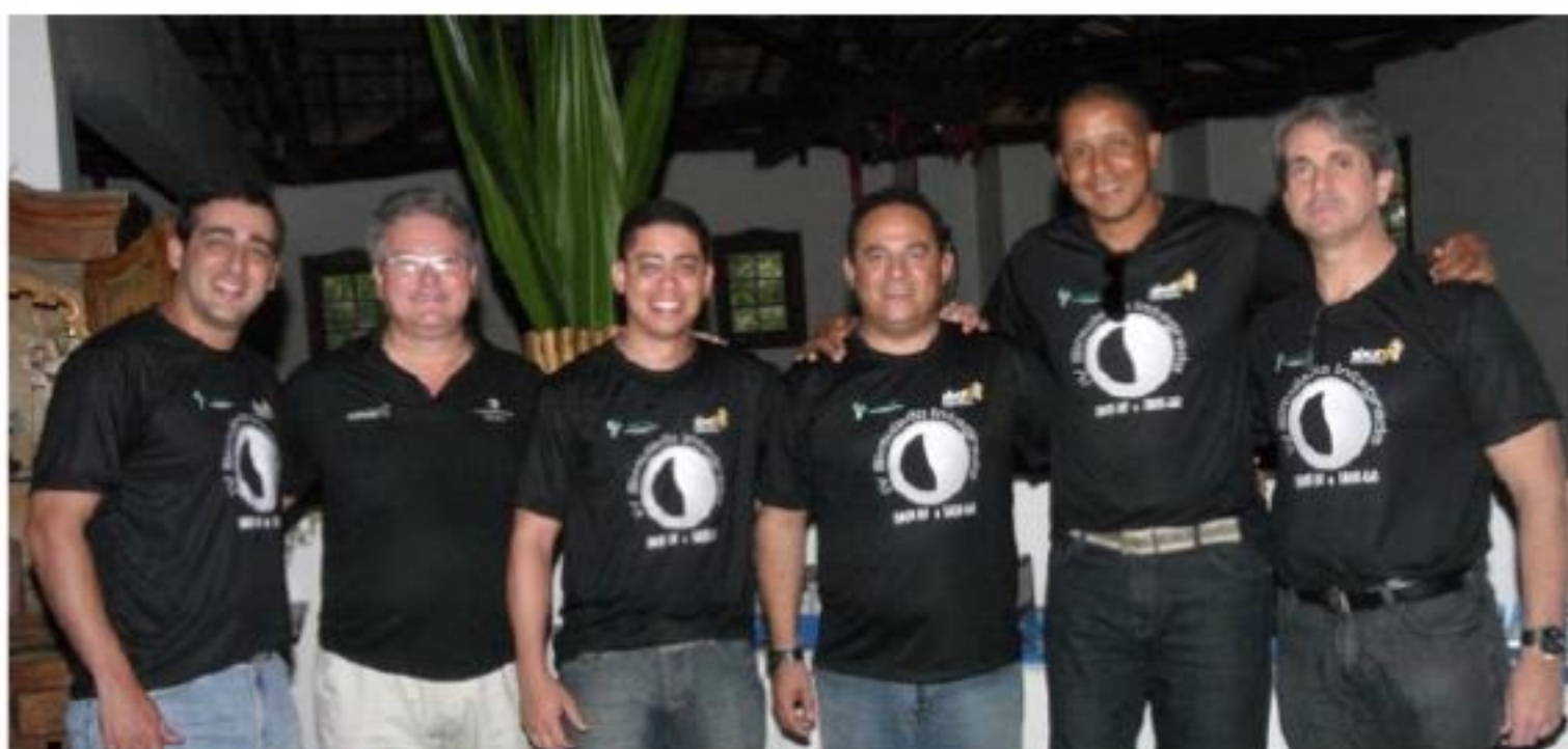
Equipe Medical Shop