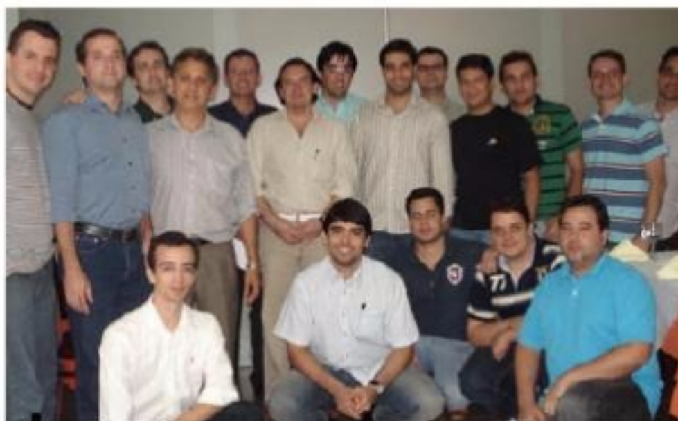
Ortopedistas presentes na comemoração

Serviço de Cirurgia de Ombro e Cotovelo do Hospital das Clínicas está habilitado a treinar ortopedistas nesta subespecialidade