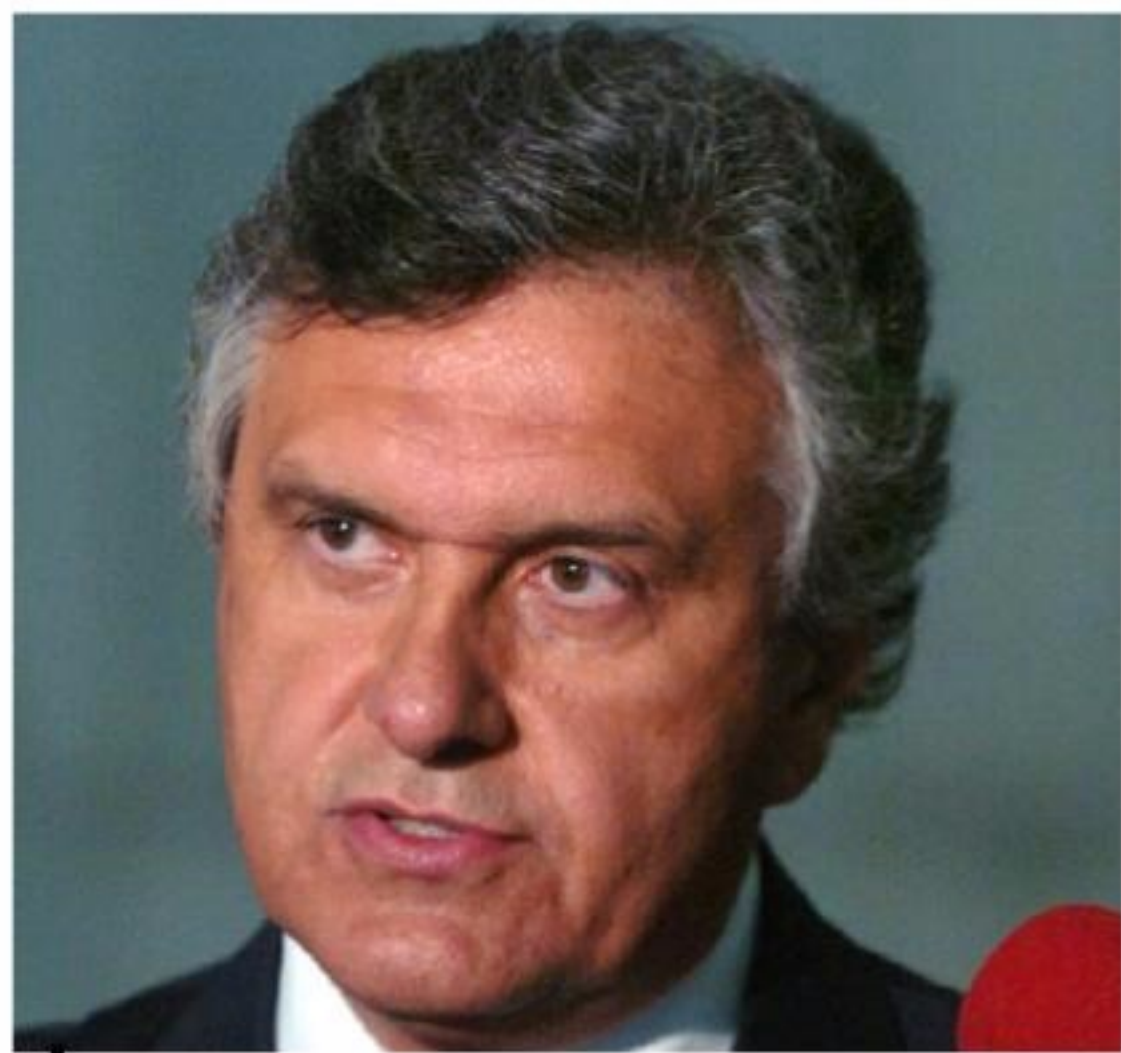
Deputado federal RONALDO CAIADO