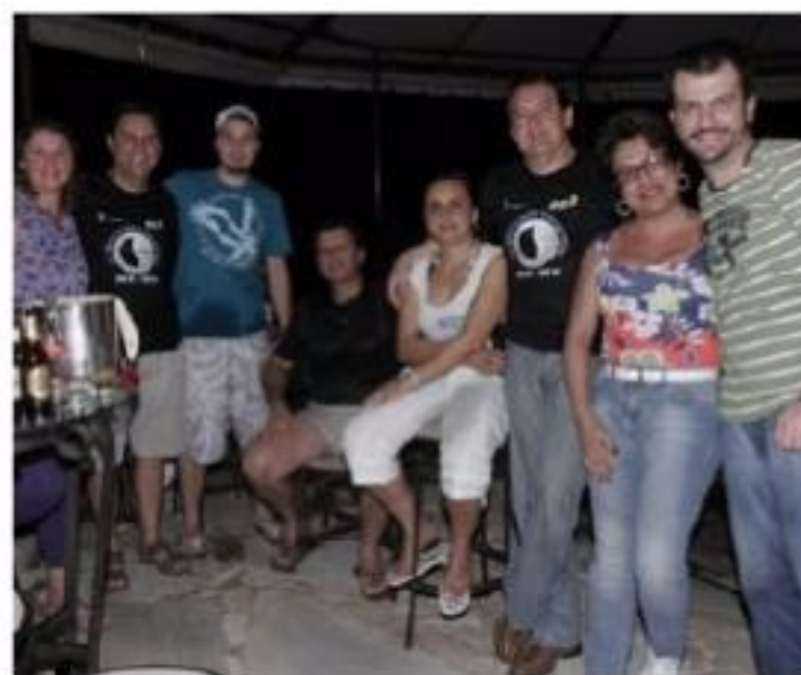
Momento de lazer e descontração