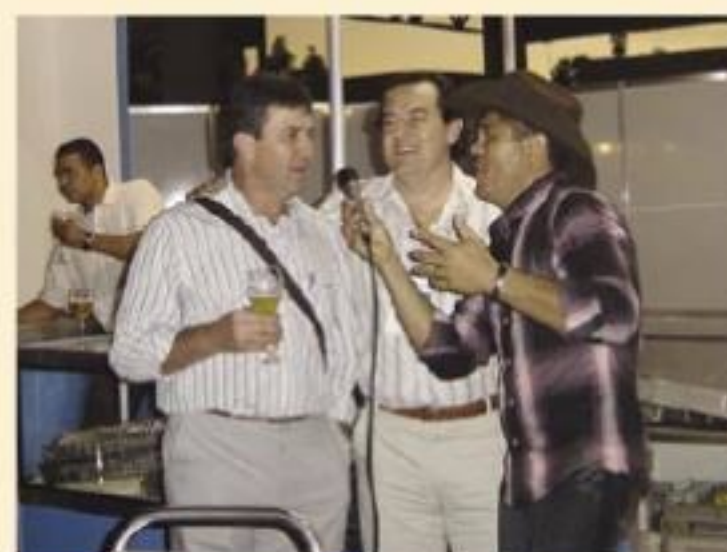
Happy hour na área dos stands

“Aprendi muito ao participar do Congresso Goiano de Ortopedia e Traumatologia em Goiânia. Sou fã dos encontros regionais da ortopedia. São menores, porém mais ricos, já que a interação entre os profissionais é muito maior e mais intensa”, fala. “Todos ensinam e aprendem. O grande beneficiário é o paciente, razão final da evolução do