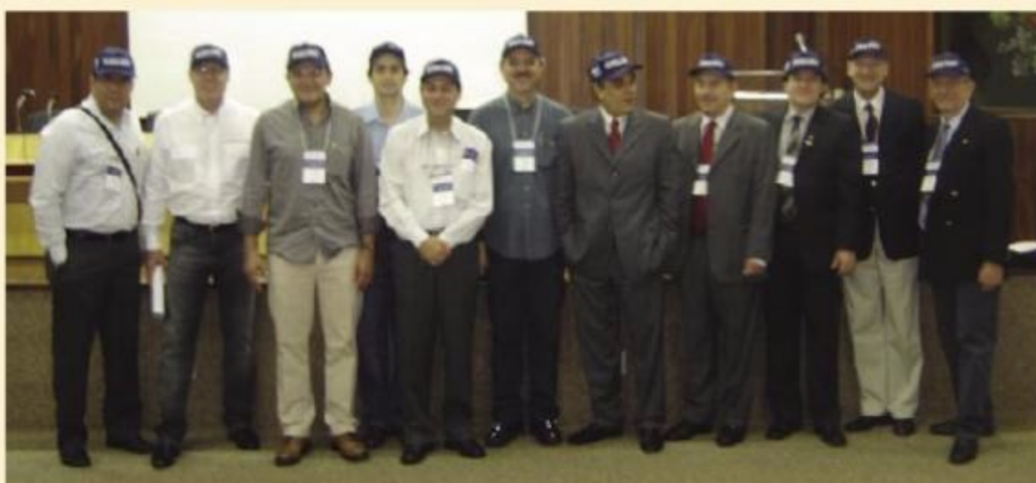
Palestrantes e comissão organizadora

Na parte social, a novidade ficou a cargo