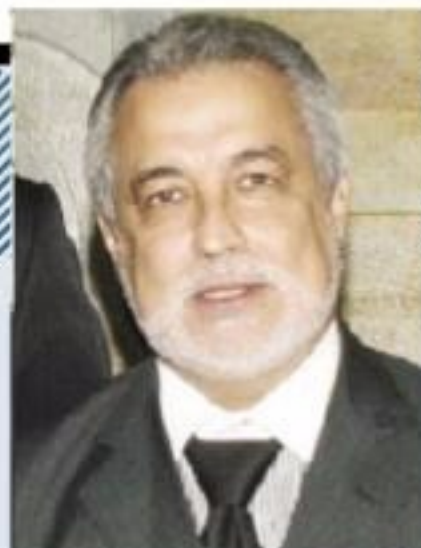
ROMEU KRAUSE | Presidente da SBOT Nacional