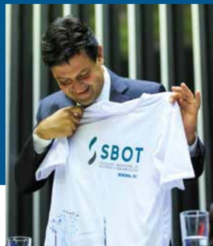
Mandetta com a camiseta da Regional Goiás