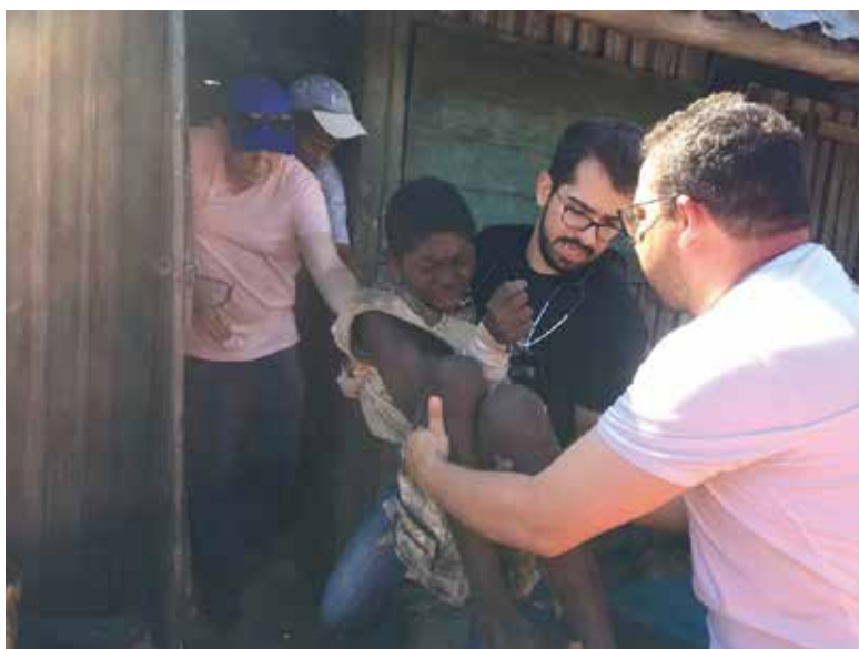
Ambovombe - Madagascar

“O AMOR DELES PARA CONOSCO E ENTRE ELES É ESPETACULAR. NO SOLO AFRICANO, SINTO EM CADA UM A PRESENÇA DE DEUS”