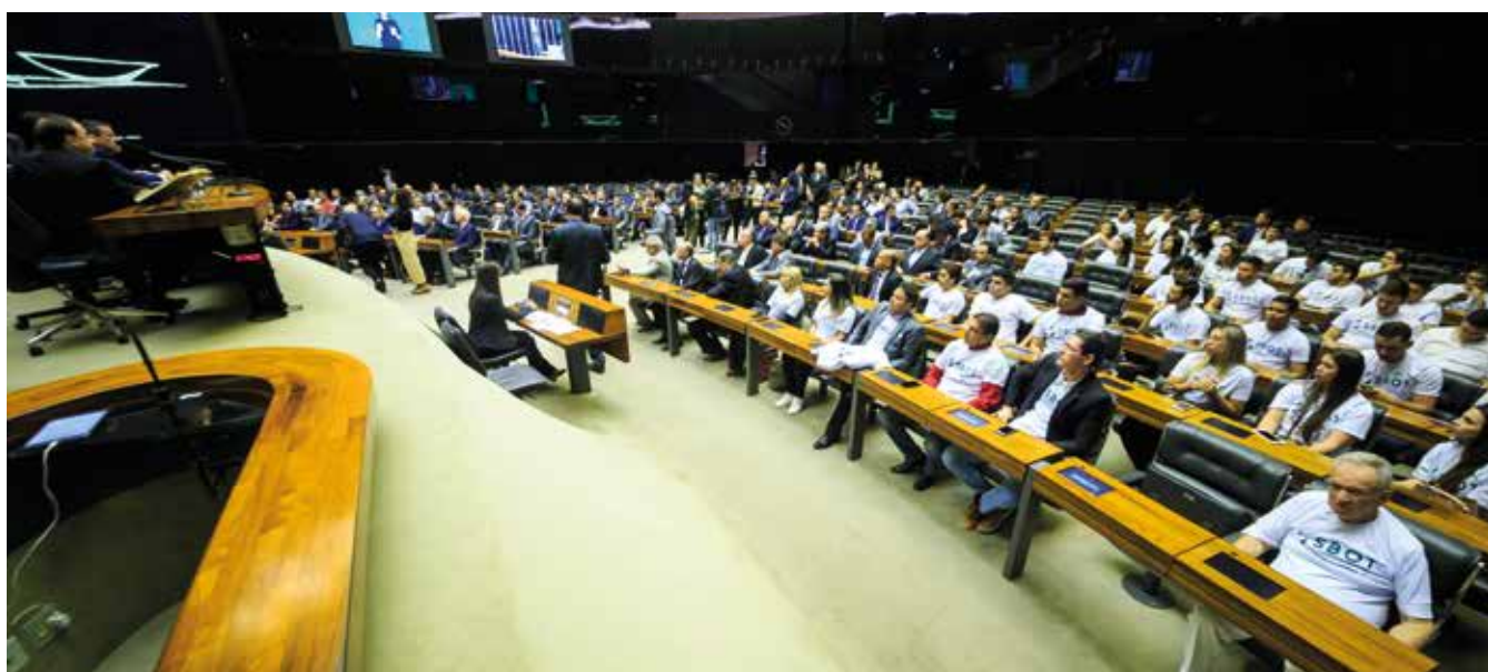
Ortopedistas no Plenário

ações mais simples até as questões mais graves de saúde pública. O momento hoje é de debate sobre a saúde pública de Goiás e de todo o país”, declarou.