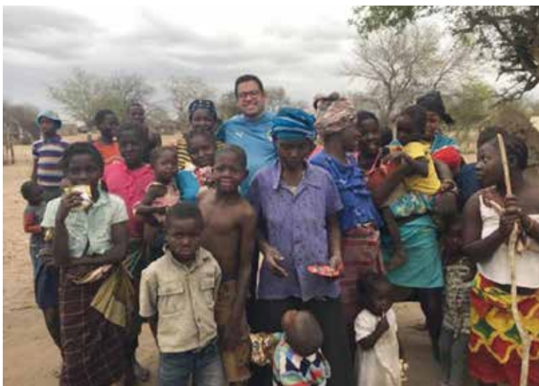
Matuba - Moçambique