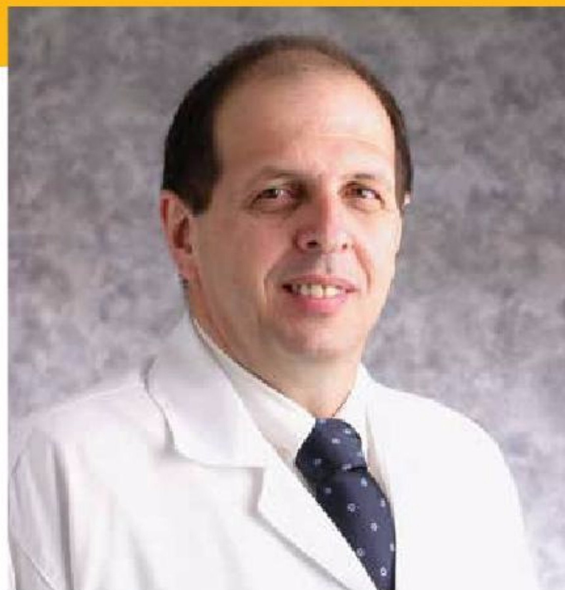
Por FLÁVIO FALOPPA , PRESIDENTE DA SBOT

Folders (como o que está ao lado) estão sendo distribuídos em praças, semáforos e postos de saúde pelo país e esclarecem que a Ortopedia é a área da Medicina que trata das doenças dos ossos, músculos, ligamentos, nervos e articulações. O folheto traz informações de quando as pessoas devem procurar um profissional, por exemplo, quando iniciam atividades esportivas ou quando estão com dores nas costas, ossos e articulações, quando sofrem algum tipo de fratura, torção ou luxação.