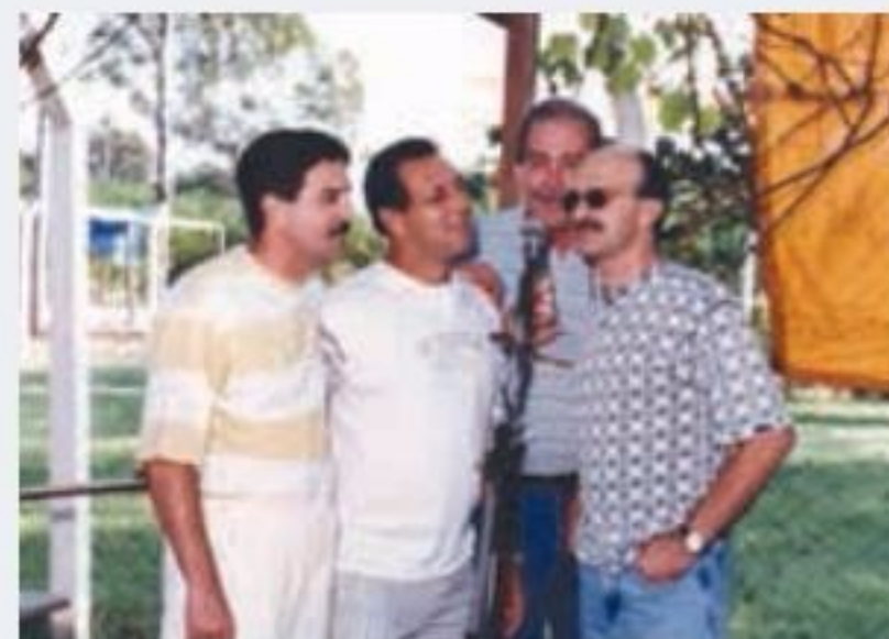
Churrasco de confraternização na JOTRAHC 1996