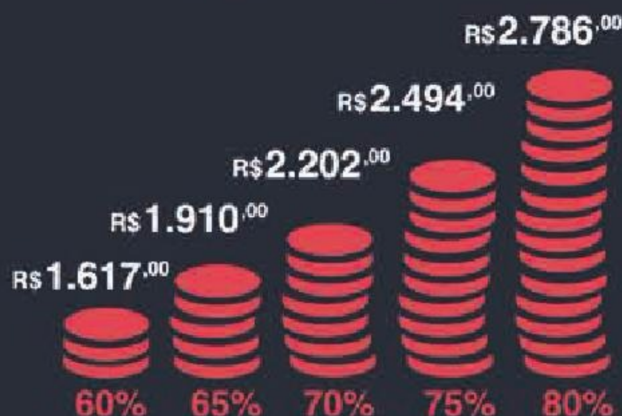
GRÁFICO DE RENTABILIDADE MENSAL

* Expectativa de rentabilidade mensal feita através de estudo de mercado realizado por empresa especializada em estudos hoteleiros (COHOTEL), referente à unidade hoteleira tipo 1403 da categoria Clarion ou Comfort, retratando resultado após o segundo ano de operação. Pesquisa realizada em Julho/2013.